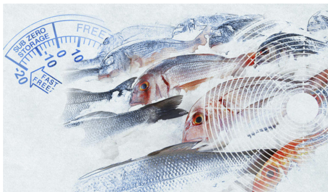
Торговое холодильное оборудование